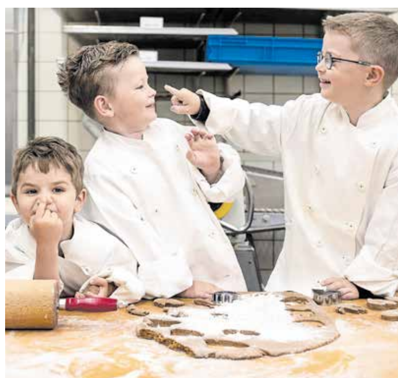
Beim Kita-Wettbewerb können Kinder die spannende Welt des Handwerks bei einem Betriebsbesuch zum Anfassen und Mitmachen erleben.

Auch die Handwerkerinnen und Handwerker profitieren von der Begegnung mit den Kindern. Diese sind von Natur aus neugierig und erkunden die Welt um sie herum