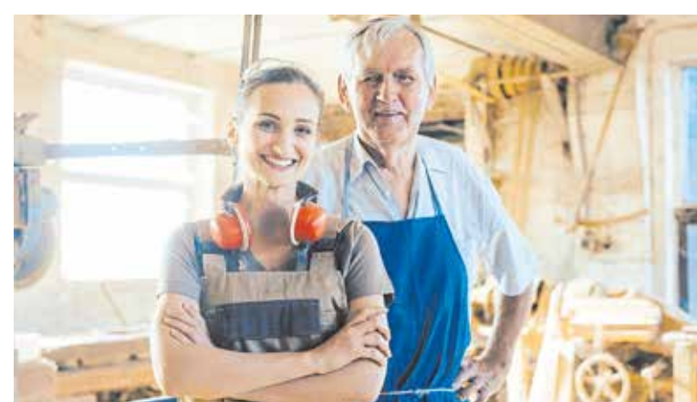
Die Firmenübergabe stellt eine Herausforderung für Übergeber und Übernehmer dar. Die richtige Vorbereitung hilft beiden.

Weitere Informationen und Anmeldung unter www.hwk-freiburg.de/weitblick