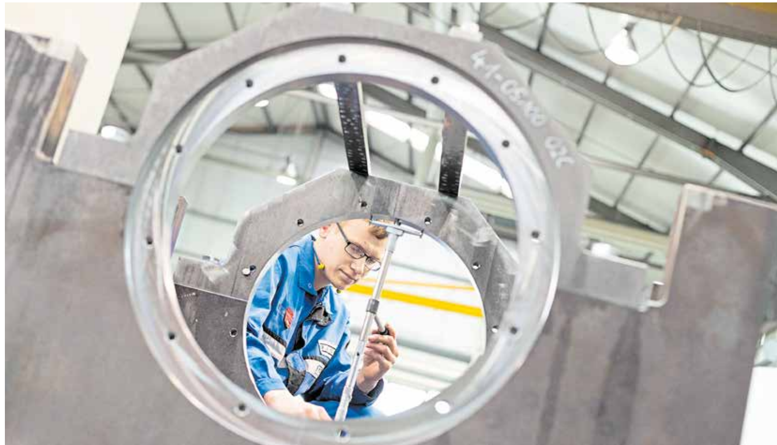
Stabiles Grundgerüst mit wenig Dynamik: Die Handwerkskonjunktur tritt unter schwierigen Rahmenbedingungen weiterhin auf der Stelle. Die Handwerkskammer Freiburg fordert von der Bundesregierung im angekündigten „Herbst der Reformen“ echte Unterstützung statt Worthülsen.

Bei den Auftragseingängen gibt es im Vergleich zum Vorjahr kaum Bewegung. 28 Prozent der befragten Betriebe melden gestiegene Auftragseingänge (Vorjahr: 27 Prozent), ein Viertel der Handwerksunternehmen (25 Prozent) musste Auftragsrückgänge hinnehmen (Vorjahr: 26 Prozent). Somit fährt das südbadische Handwerk ein minimales Auftragsplus ein. Die Anstrengungen, die die Handwerksunternehmen unternehmen müssen, um dieses Level zu halten, haben jedoch deutlich zugenommen.